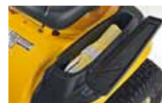
schránka na nářadí