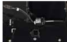
signalizace naplnění koše