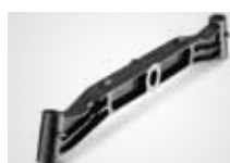
HEAVY-DUTY rám, litinové nápravy