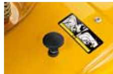
snadné sundávání koše