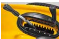
posilové výškové nastavení sečení