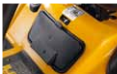
schránka na nářadí

Č ím větší je plocha na sekání a čím větší je čas strávený údržbou zahrady, tím více toužíte po větším výkonu a pohodlí. Traktory série 1000 Vám přinesou neopakovatelný komfort a výkon ruku v ruce s prémiovou kvalitou sečení. Komfortní sedadlo, měkčený volant, snadno přístupné ovládací prvky, nejintuitivnější rozmístění pedálů, tempomat nebo minimální poloměr otáčení – to vše Vám neuvěřitelným způsobem usnadní práci. Spolu s nepřekonatelně tuhým svařovaným rámem, výkonnými motory a spoustou luxusních prvků pochopíte, proč tyto stroje představují absolutní světovou špičku.