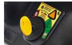
REVTEK – sečení při couvání