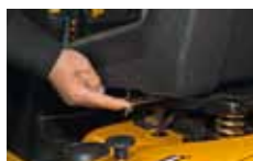
10 poloh sedačky