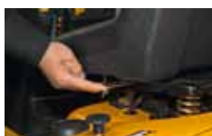
10 poloh sedačky