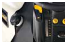
optická kontrola stavu paliva