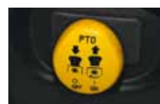
elektrické spínání sečení